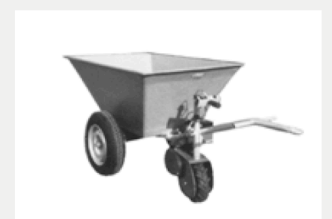
Chariot avec moteur électrique